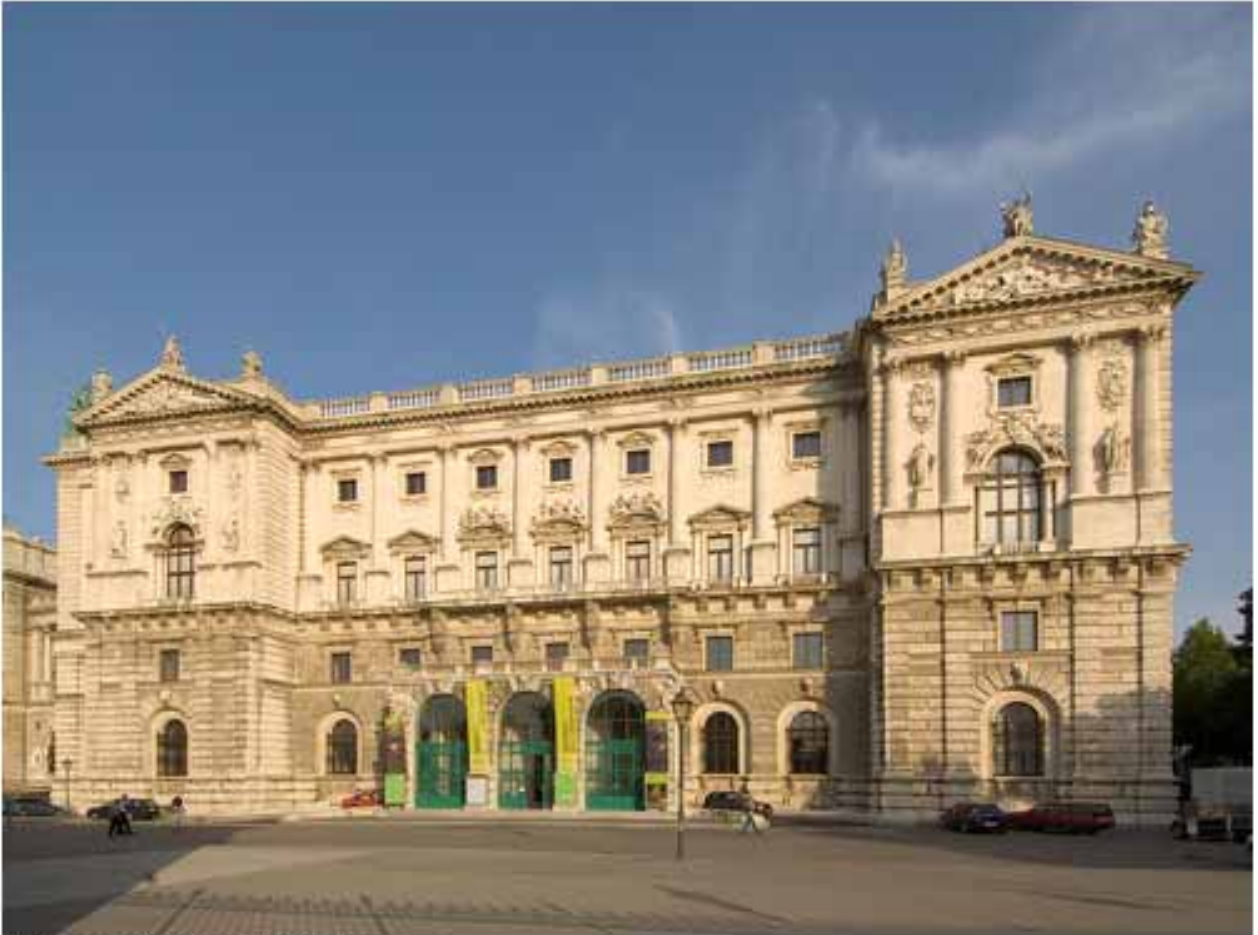
Museum für Völkerkunde