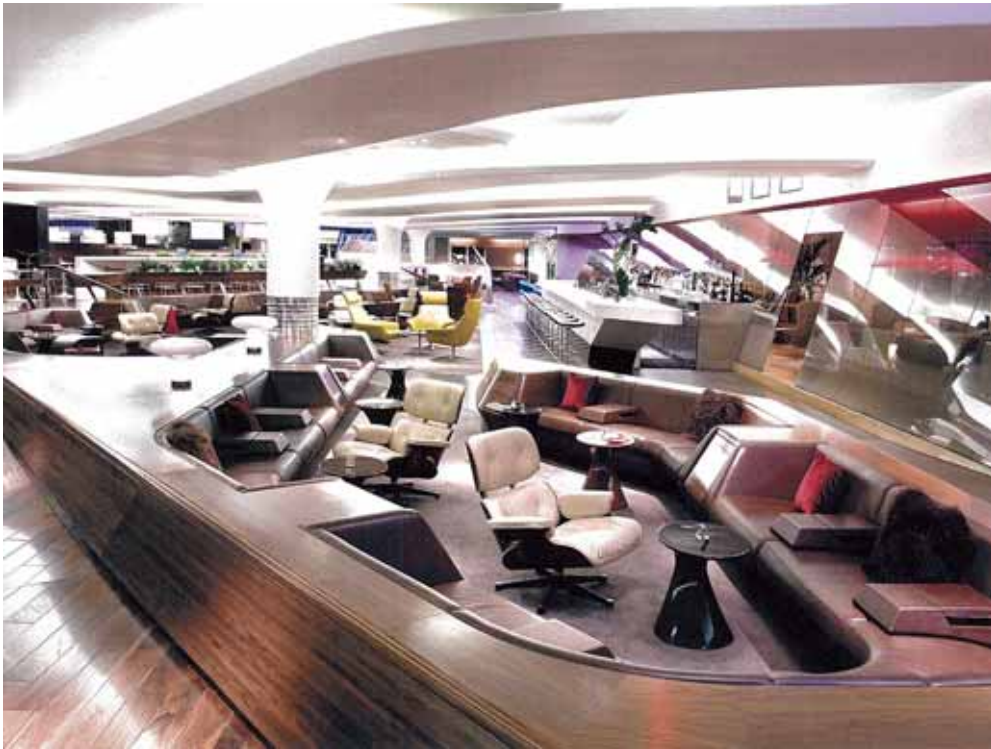
Virgin Clubhouse, Heathrow Airport Terminal 3