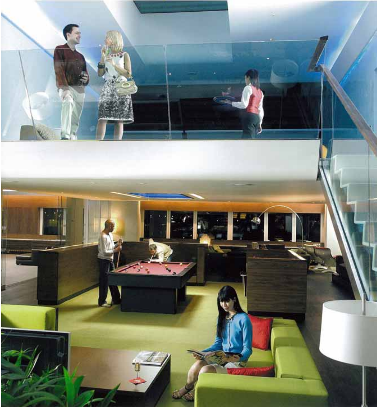
Virgin Clubhouse, Heathrow Airport Terminal 3